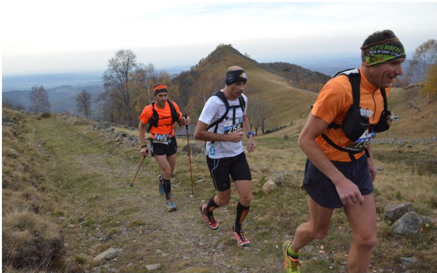
TRAIL MONTE CASTO