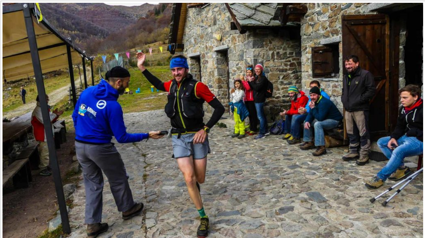
It's hard not to smile with this sort of support along the route. This is the halfway aid station that also serves beer and wine.