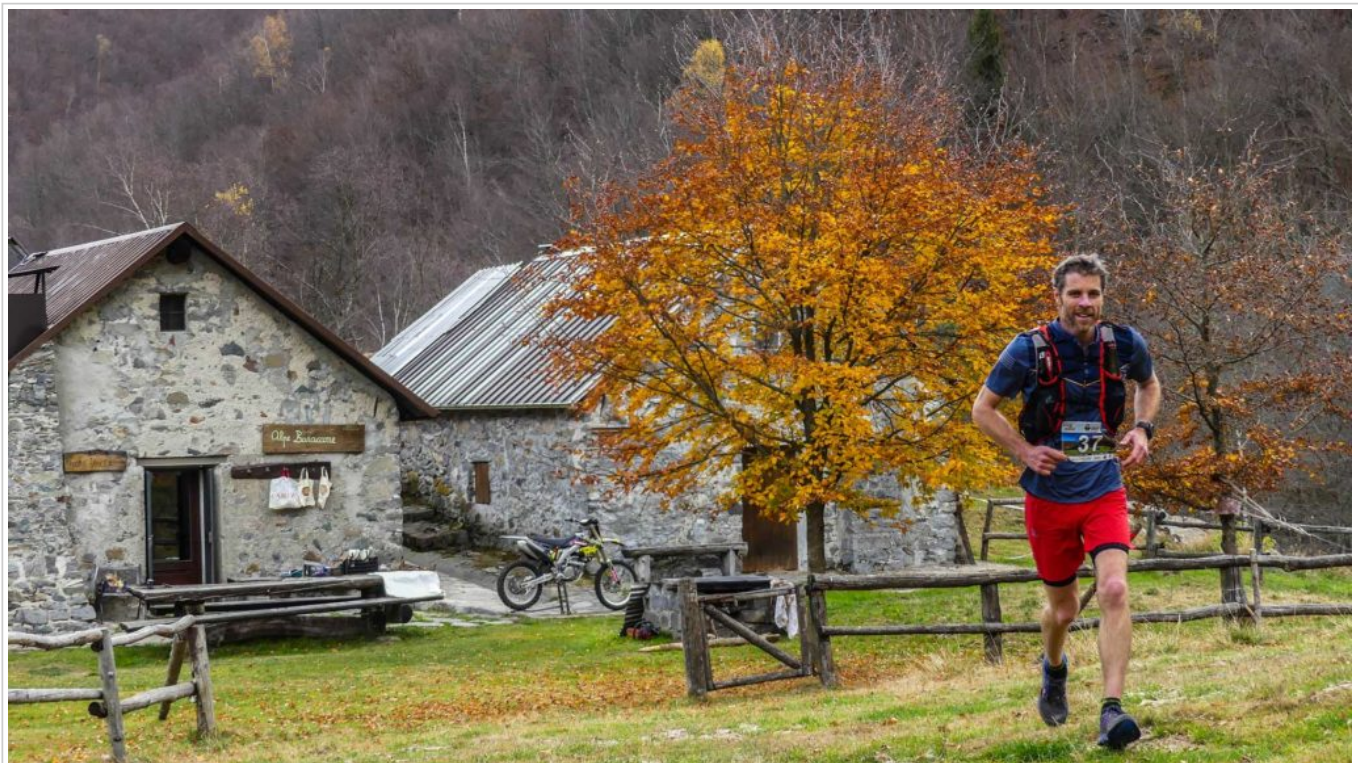
The author mid-race amid the colours of autumn.